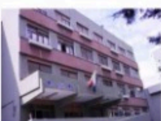
Plesso De Amicis