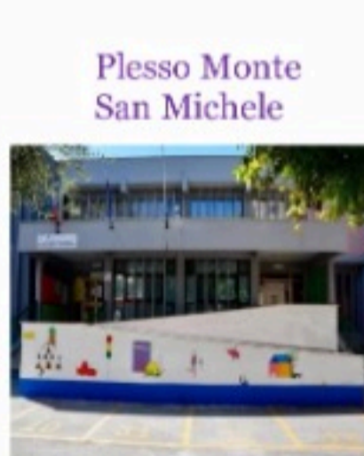
Plesso Monte San Michele

"La Scuola è il nostro passaporto per il Futuro poiché il Domani appartiene a coloro che oggi si preparano ad affrontarlo".