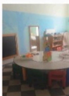
Plesso Del Prete

Progetto Accoglienza Progetto Lettura Progetto Psicomotricità Progetto Lingua inglese Progetto Continuità Progetto Matematica STEM Progetti Europei: PON-FESR- PNRR-ETWINNING - ERASMUS+