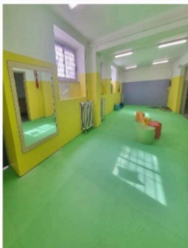
Aula Morbida Polifunzionale Plesso Mungivacca